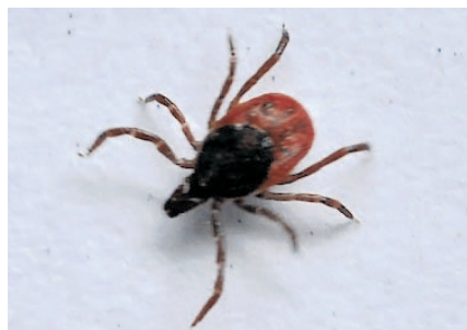
Flåtten er til pest og plage for både mennesker og dyr.

– Tiril ble satt på en omfattende antibiotikabehandling, samt spesialkost og