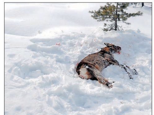
Dette rådyret ble spist på av en hund.